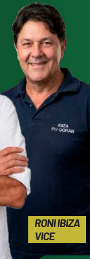
RONI IBIZA VICE